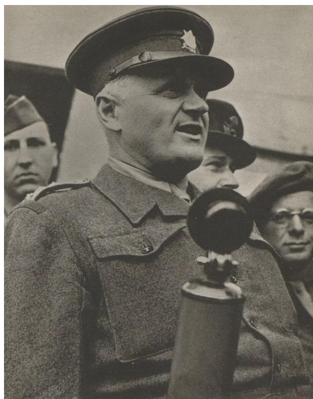
Obr. 7: Bohuslav Ečer po předání K. H. Franka na Ruzyni dne 7. srpna 1945.