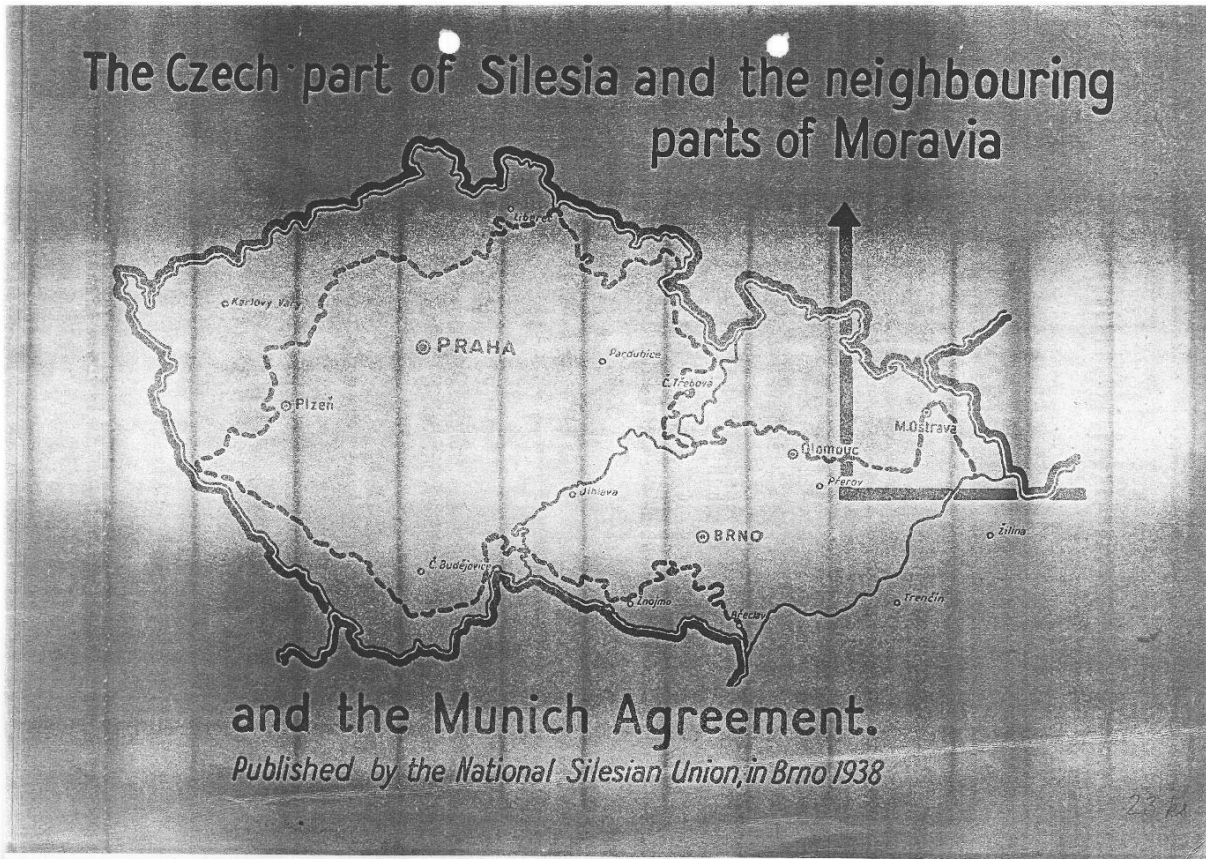
Obr. 3: Titulní strana dokumentu The Czech part of Silesia and the neighbouring parts of Moravia and the Munich Agreement.