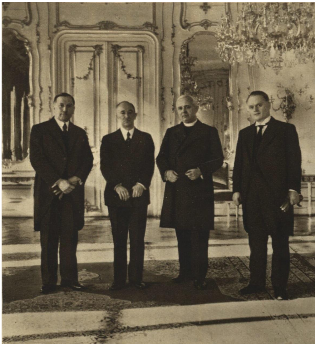
Obr. 2: Bohuslav Ečer (první zprava) při příležitosti předání diplomu čestného občanství města Brna prezidentu Edvardu Benešovi dne 11. ledna 1937.