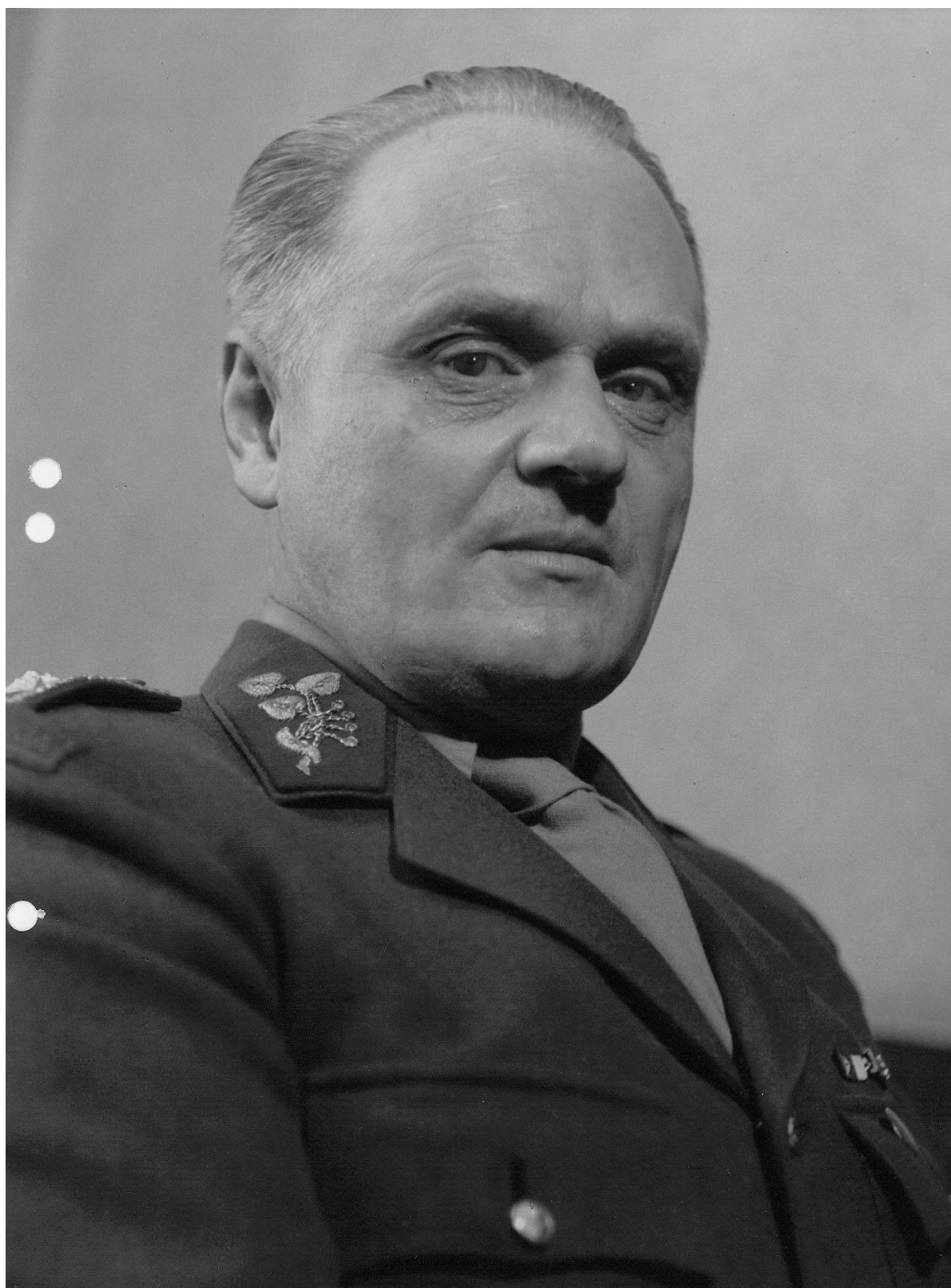
Obr. 15: Portrét Bohuslava Ečera.